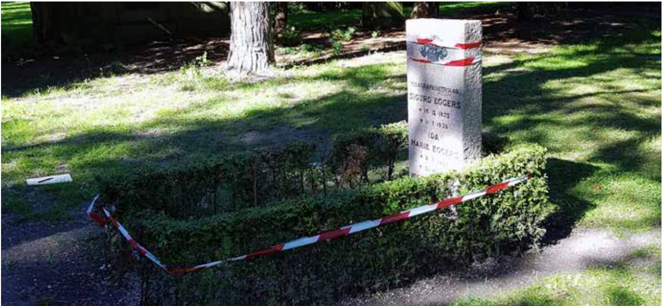
På årsmødet kan høre mere om den aktuelle status på arbejdet med at sikre gravminderne på Københavns kommunes kirkegårde.