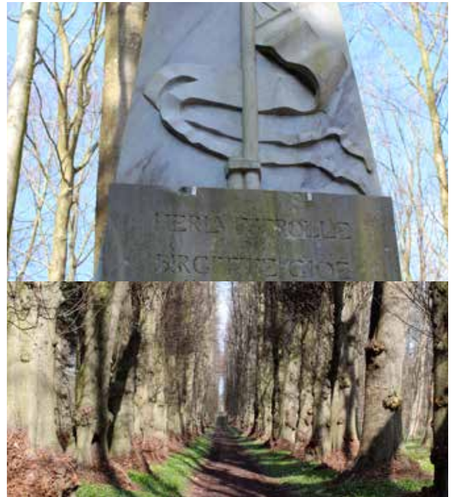
I Slotsparken og skoven ved Jægerspris Slot er der opstillet 54 mindestøtter over kongerigets store mænd og kvinder. Her ses mindestøtten over Herluf Trolle og Birgitte Gøye, der var ejere af godset Hillerødsholm (Frederiksborg Slot) indtil 1560 og som efter et mageskifte med Kong Frederik d.2., oprettede kostskolen Herlufsholm i 1565. Herlufsholm ejer i dag en af de få privatejede kirkegårde i Danmark.

1970'erne boede der kun 4 kvinder i det efterhånden noget forfaldne hus. Dansk Kvindesamfund får i 1978 tilbud om at købe huset, men har ikke de nødvendige midler og huset sælges i stedet til nedrivning. Ideen om et hus for nødstedte kvinder lever dog stadig, og i 1979 besættes huset i Nansensgade af en gruppe kvinder, der maler de fire karakteristiske røde kvindetegn med knyttede næver i vinduerne. Gennem en landsdækkende indsamling, lykkes det kvindegruppen at rejse midler til at købe huset. Kort tid efter etableres det krisecenter for voldsramte kvinder og børn, der er kendt som Dannerhuset.