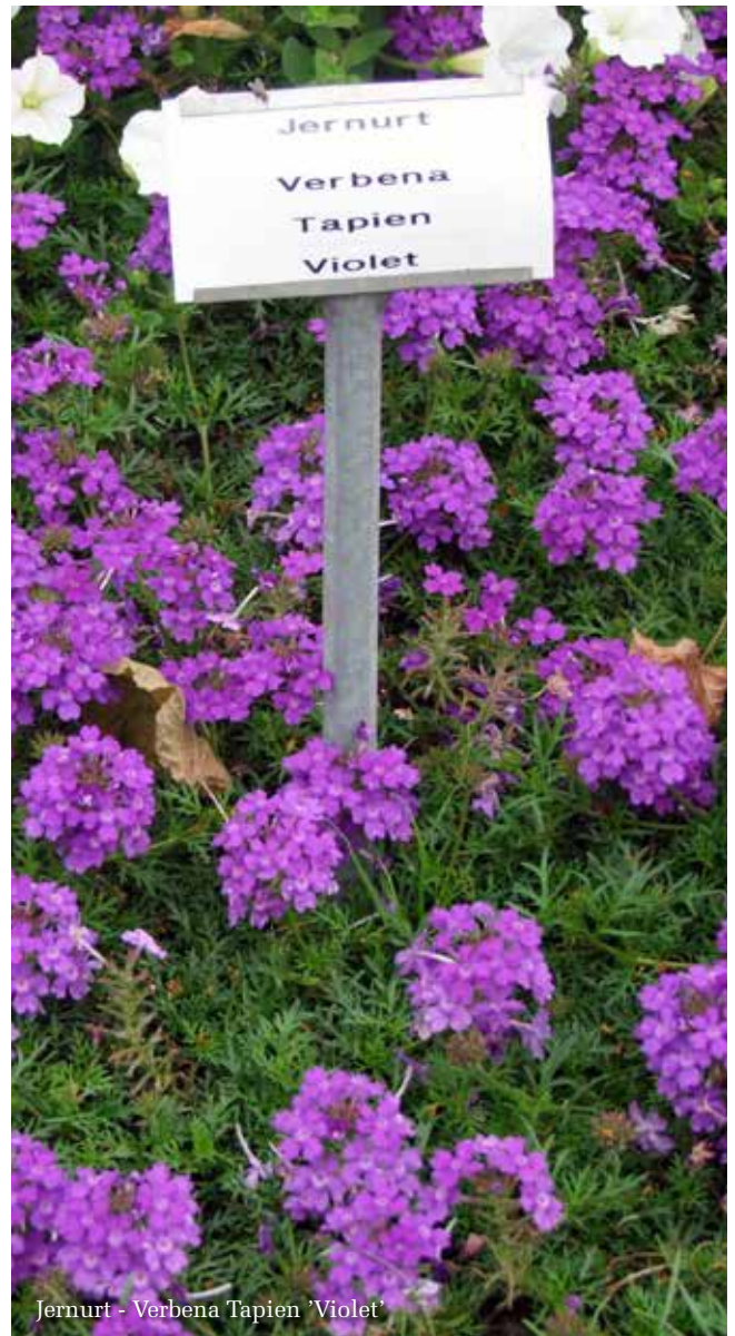
Jernurt - Verbena Tapien 'Violet'

forhold til deres ønsker. Med tiden har vi både tilføjet og fjernet arter i sortimentet.