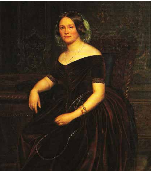
Grevinde Danner lagde et stort arbejde og engagement i at hjælpe fattige pigebørn og kvinder. Hun var gift med Kong Frederik d. 7., til venstre hånd.