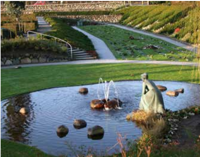
Den anonyme fællesgrav på Nyborg Kirkegård. I baggrunden ses Urnegården fra 1957, der er anlagt i en tørlagt voldgrav.