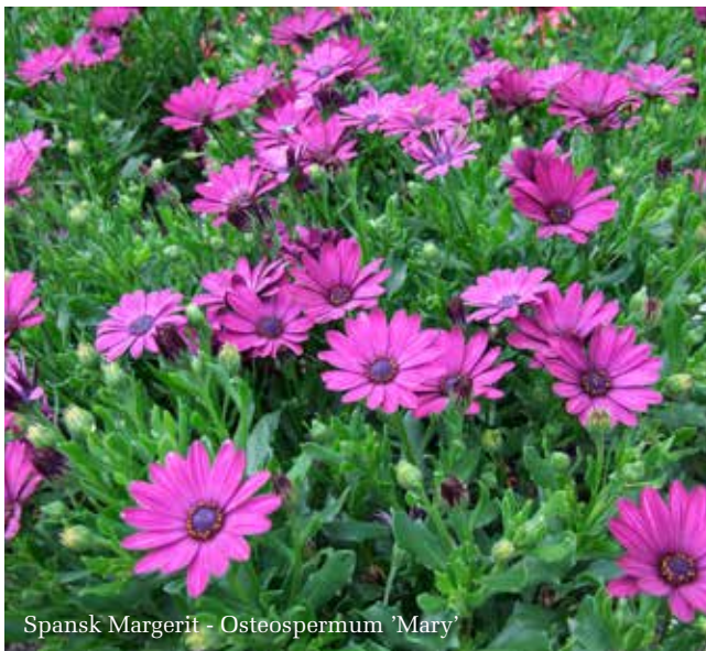
Spansk Margerit - Osteospermum 'Mary'