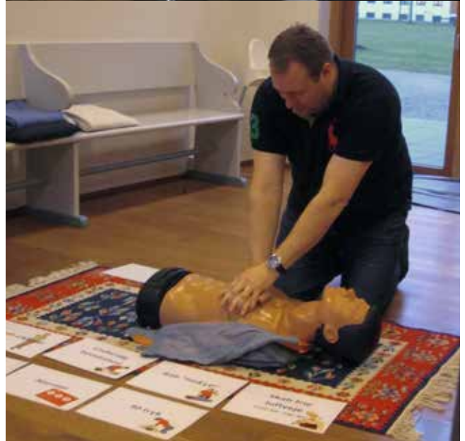
Undervisningen foregår med både teori og praktiske øvelser i bl.a. hjertemassage.