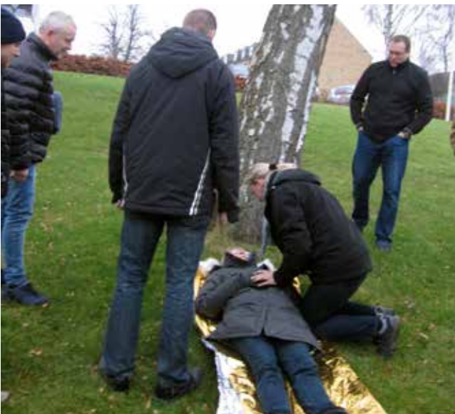
Den nyerhvervede viden afprøves i forskellige cases, både ude og inde.