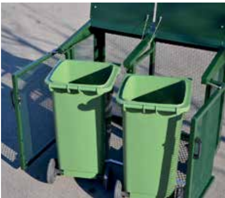
affaldssortering med bl.a. BIKAB