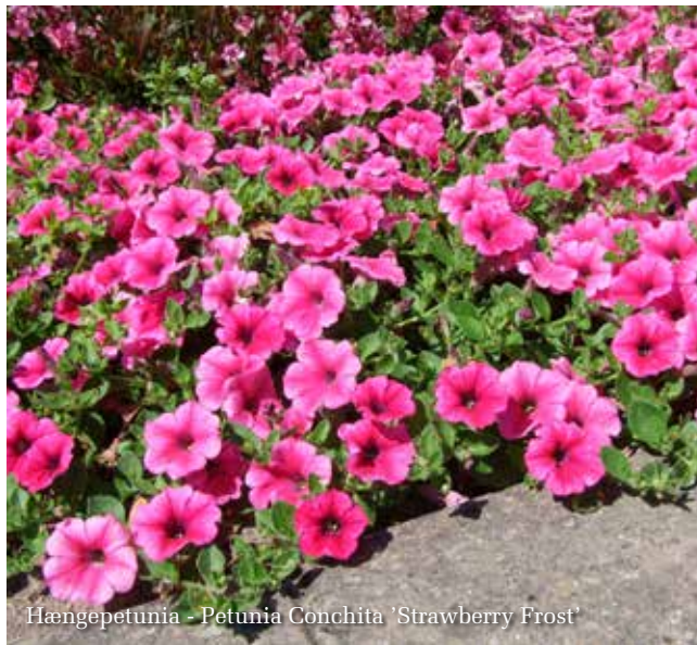
Hængepetunia - Petunia Conchita 'Strawberry Frost'