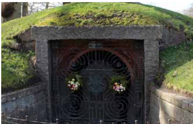
Grevinde Danners gravsted i Slotsparken ved Jægerspris Slot.

Af Lene Halkjær Jensen, lene.bladet@mail.dk