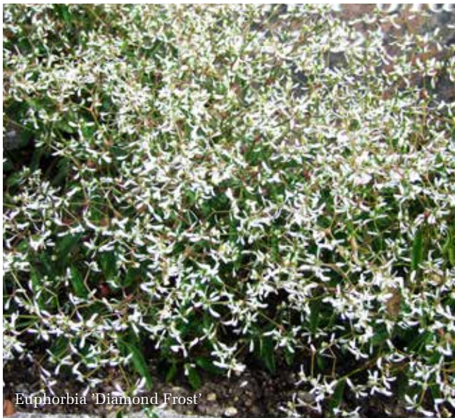
Euphorbia 'Diamond Frost'