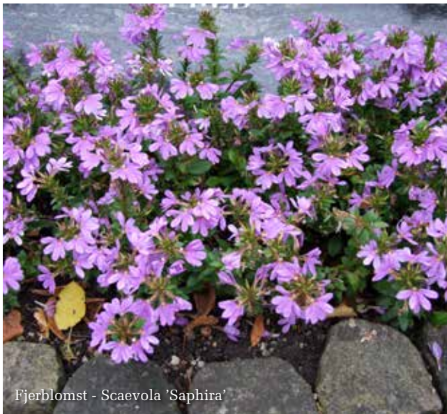
Fjerblomst - Scaevola 'Saphira'