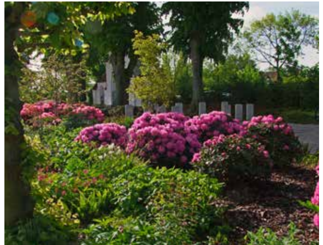
Rhododendronhaven på Nyborg Assistenskirkegård. I baggrunden ses de mindstene, der er rejst over 11 faldne Commonwealth-soldater fra Anden Verdenskrig.

år på Landbohøjskolen, så det var yderst begrænset. Til gengæld var jeg ved at være godt inde i de økonomiske begreber og tankegange.