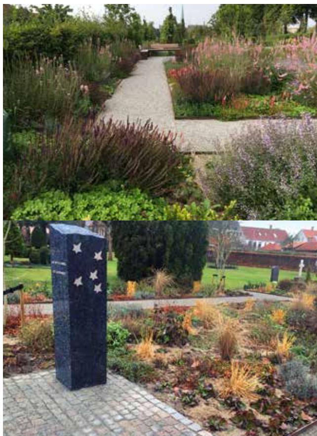
Alternative gravstedsformer på Nyborg Kirkegårde.

Jeg blev færdig som hortonom, med der var ikke nogen job at få, så for at holde mig i gang begyndte jeg på HD på handelshøjskolen (nu CBS). Sidst på året kom der flere jobmuligheder, og jeg fik mit første job som produktionsplanlægning-konsulent for potteplantegartnere hos Dansk Erhvervsgartnerforening i Odense. Mit kendskab til potteplanter bestod i to timers undervisning i et halvt