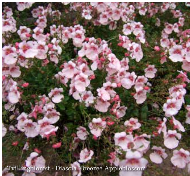
Tvillingblomst - Diascia 'Breeze Appleblossom'

rigtig flot. Den kan være lidt besværlig at få i gang, da den skal holdes godt opvandet indtil den har etableret sig. Man skal også vogte sig for sorter, der ikke gror så godt. I vores sortiment har vi også hængepetunia, kompakte Verbena og Euphorbia. Hele sortimentet med priser findes på vores hjemmeside under takster.